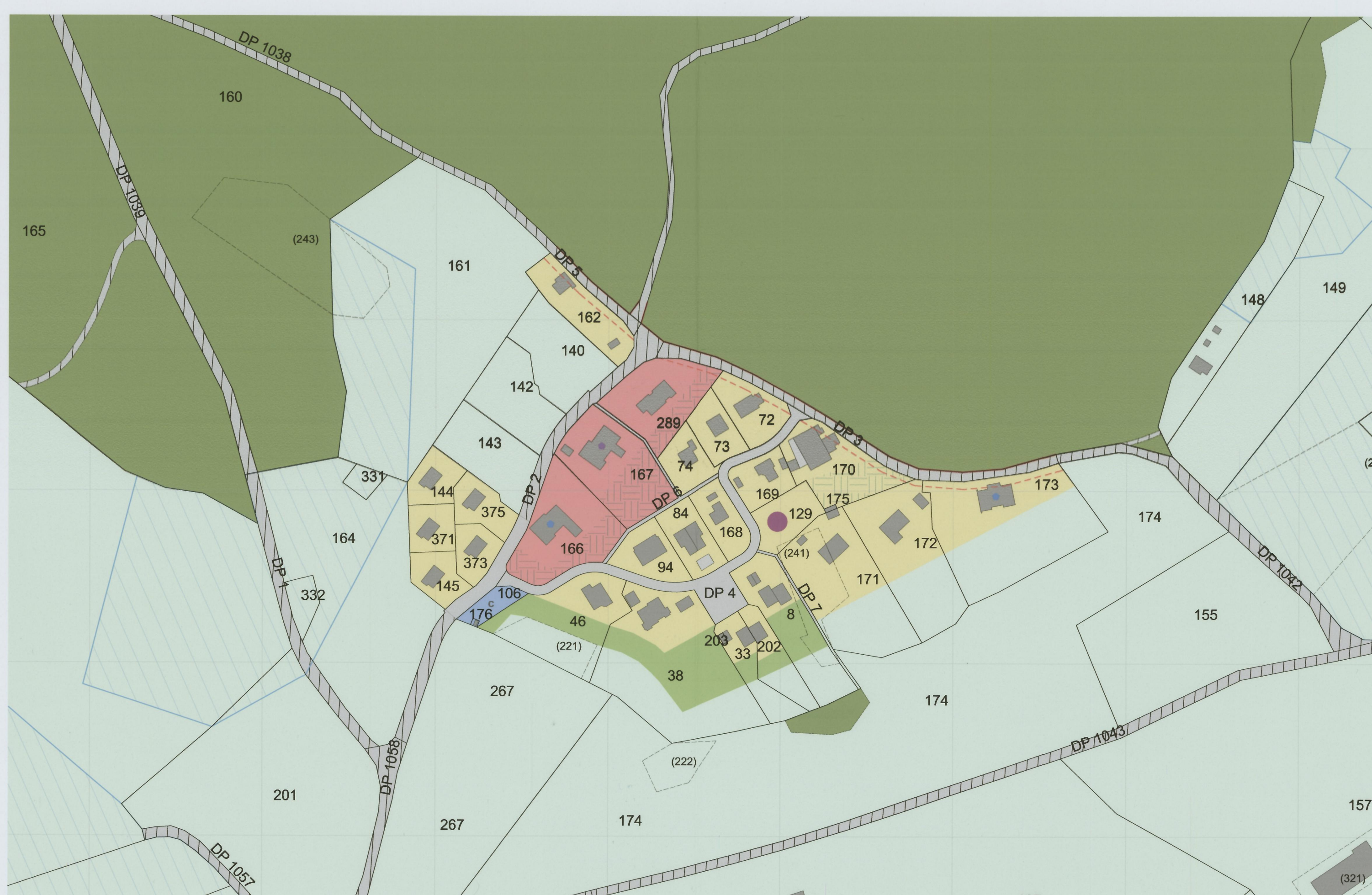
Secteur "La Mellette" extrait 1/2000