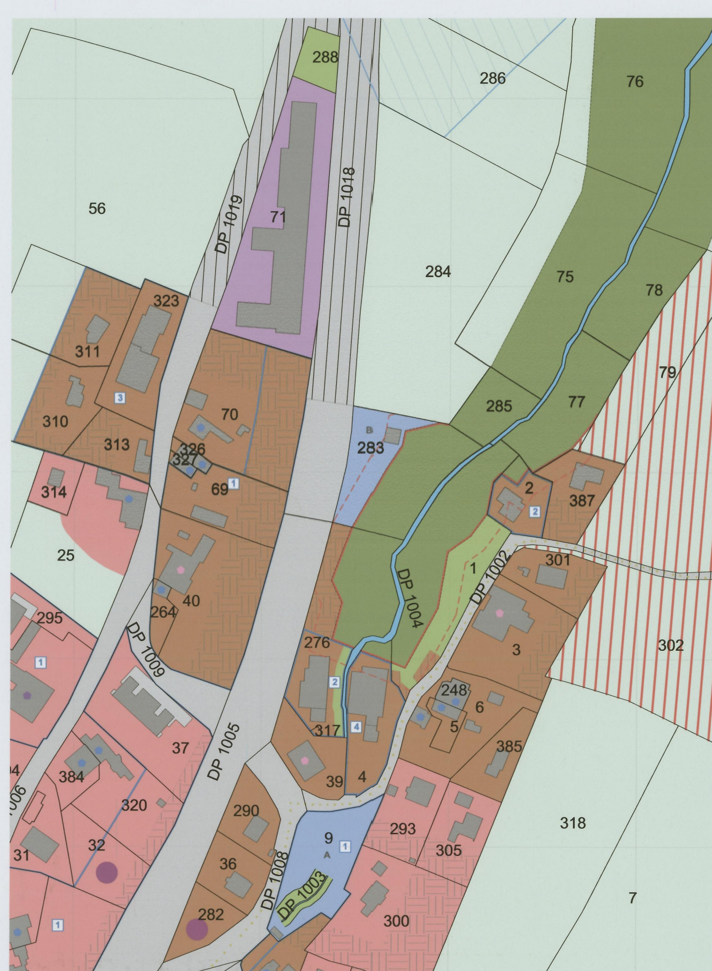
Secteur "La Rochette" extrait 1/2000