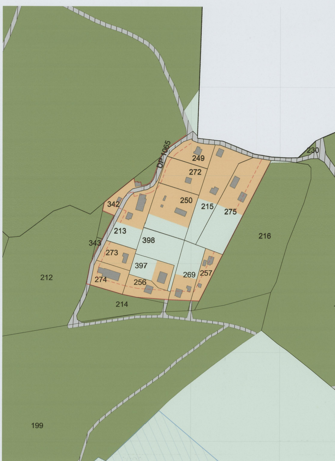
Secteur "Moille Baudin" extrait 1/2000